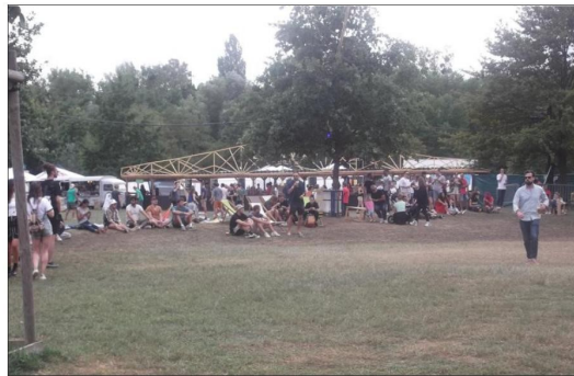
Discrets en début d'après-midi, les danseurs se sont un peu enhardis par la suite.

Pour clôturer ce festival Longevity de trois jours en beauté, la journée du dimanche a rassemblé un grand nombre d'animations.