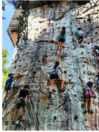
Le mur extérieur, d'une hauteur de 10 mètres.

Rappelons que l'ASCPA compte en ses membres de nombreux champions, certains au niveau mondial.