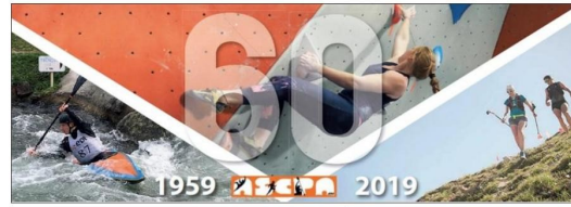
Escalade, mais aussi canoë-kayak et trail sont proposés par l'ASCPA.